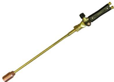
Рис.2 Горелка ГП-1 Шторм