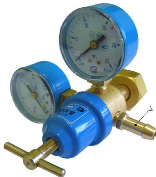
б) ДЖЕТ.156.00.00.00-03, -07