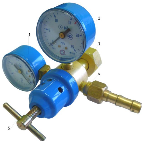
а) ДЖЕТ.156.00.00.00, -02, -05

4.1 Внешний вид редуктора показан на рис.1, 2